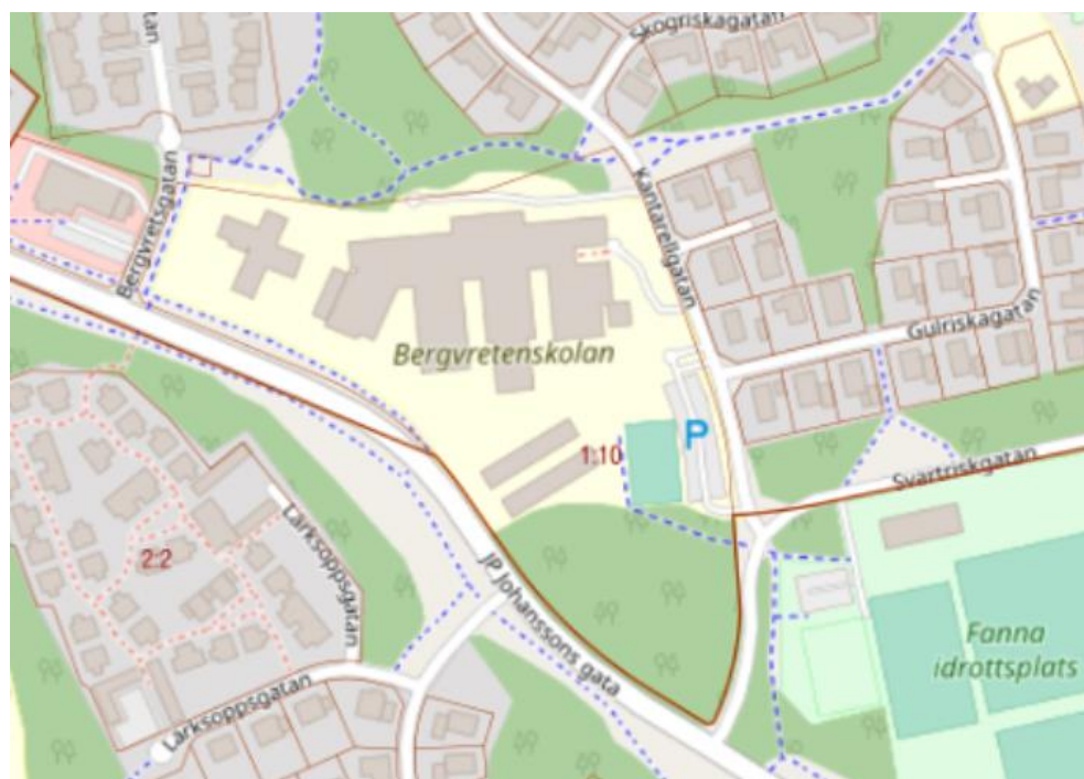
Karta 3: skolans koppling till närområdets infrastruktur

En mer detaljerad bild än planmosaikerna ovan, av skolans anslutningar till omgivande miljöer, med upplevelseförvaltningens idrottshall öster om fastigheten, större bilväg sydost om fastigheten och bostäder i andra väderstreck.