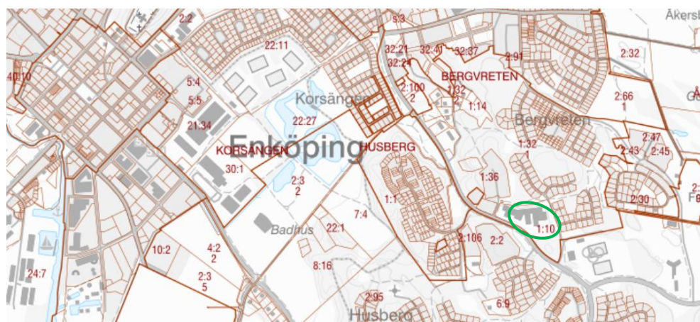
Karta 1: Skolans och fastighetens läge i Enköping tätort